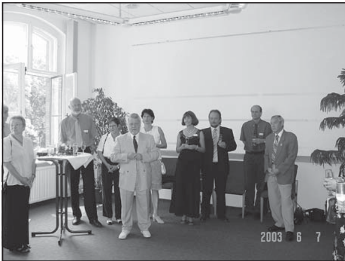
Empfang des Bürgermeisters im Rathaus

offiziellen und sehr beeindruckenden Feier, die neben dem polnischen Grundschulchor auch vom Zeuthener Männerchor und dem Chor der Grundschule am Wald gestaltet wurde, gab es zahlreiche Begegnungen und Gespräche mit den polnischen Gastgebern. Ob es die Kontakte der Feuerwehren, der Senioren, der Vereine, der Schüler, der Gemeindevertretung und der Gemeindeverwaltung waren, es