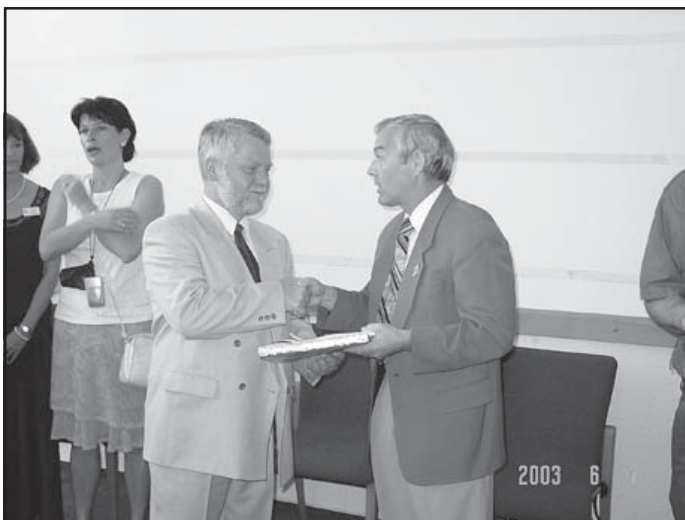
Austausch von Gastgeschenken zwischen Bürgermeister und Gemeinderatspräsident

wurden weitere Weichen gestellt für den Zug der europäischen Annäherung. Die Begegnungen mit den Gastgebern und die Exkursionen im Ort Malomice und in die nähere Umgebung zeigten den großen Nachholbedarf unseres Nachbarlandes auf fast allen Gebieten des Gemeindelebens. Vielleicht besteht aber gerade darin die Aufgabe einer solchen Städtepartnerschaft, nämlich Mut, Hoffnung und Solidarität für den weiteren Weg von Malomice zu vermitteln. Wenn das mit dem Besuch am 14. und 15. Juni gelungen ist, ist wieder ein großer Schritt in die gemeinsame europäische Zukunft getan. (Sünderm.)