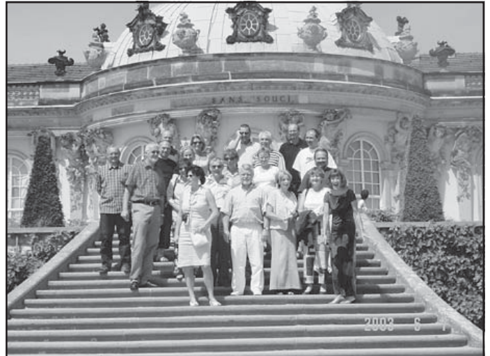
Großes Interesse zeichneten die Schweizer an der preußischen Geschichte unseres Landes aus.

Tourismus) und der Vorsitzende des Fischereivereins unseren Ort über Pfingsten. In einem umfangreichen Sightseeing-Programm machte die Gemeinde ihre Gäste mit ihrem Ort, der Landeshauptstadt Potsdam und natürlich