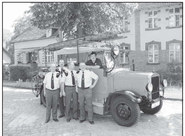
Die Feuerwehroffiziere nach der Rundfahrt im Traditionsfahrzeug des Löschzuges Zeuthen

Der Feuerwehrkommandant Interlakens und drei Feuerwehr-offiziere waren am Pfingstsonntag gern gesehene Gäste bei der Freiwilligen Feuerwehr Zeuthen. Man tauschte Informationen über Ausbildung und Technik aus und un-