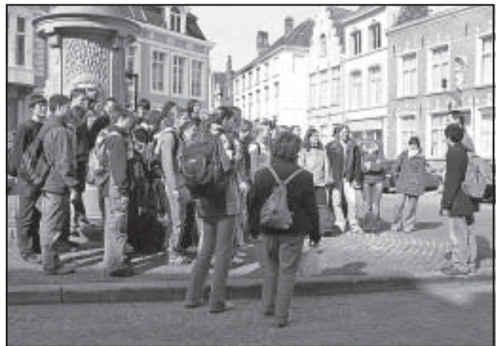
Der Chor schickt sich an ein Geburtstagsständchen zu singen

ben gefühlt und es sind viele neue Kontakte geschlossen worden. Die Kommunikationswege sind heute ja kurz - dank SMS und E-Mail. Man kann sich nur wünschen, dass diese Kontakte möglichst lange halten. Und es ist sicher auch wünschenswert, dass sich der Austausch zwischen Schülern der beiden Schulen und vor allem zwischen den beiden Chören fortsetzt. Europa