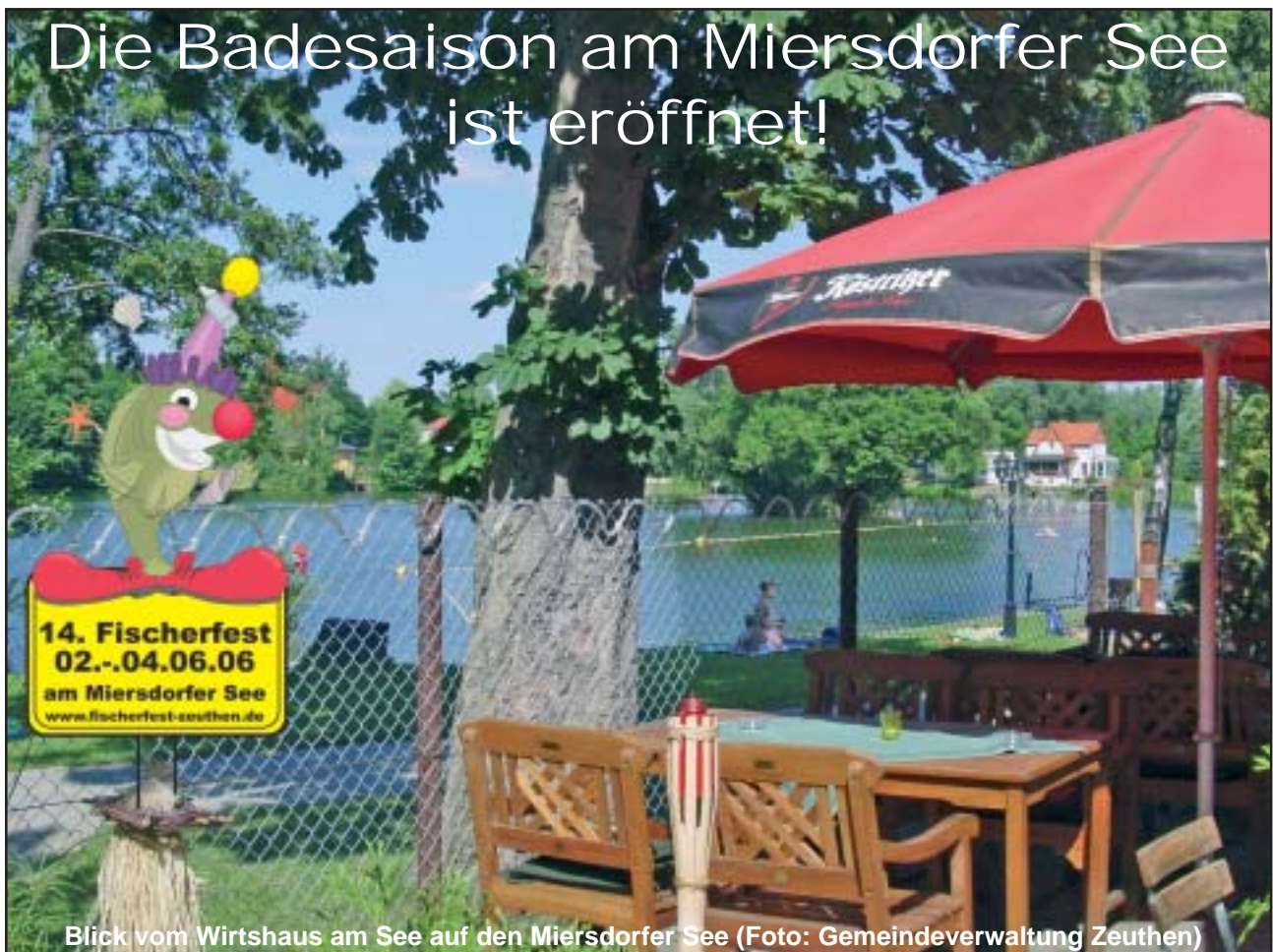
Blick vom Wirtshaus am See auf den Miersdorfer See

Die Badesaison am Miersdorfer See ist eröffnet!