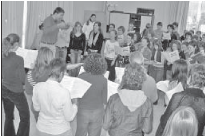
Momentaufnahme während einer Probe des gemeinsam gesungenen Repertoires

ler dann noch weitere kunsthistorische Schätze besichtigen und machten davon auch regen Gebrauch. Zwischendurch wurde aber auch immer wieder gesungen. Vor der Burg in Gent hatte der Chor sich für ein Gruppenphoto aufgestellt. Den Platz verließ er dann singend, was vom Genter Publikum mit viel Interesse und Freude aufgenommen wurde.