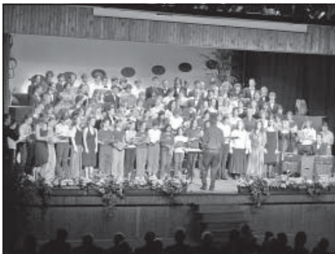
Die beiden befreundeten Chöre bei ihrem gemeinsam bestrittenen Teil des Frühlingkonzerts