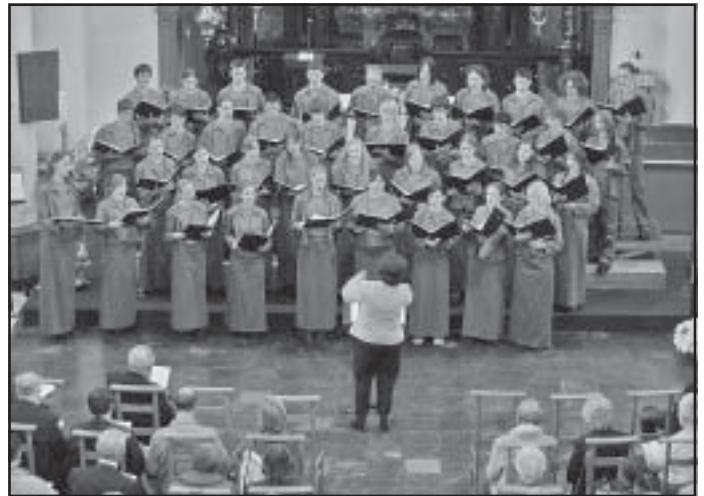
Der Paul-Dessau-Chor bei seinem Konzert am 19. April 2006 in der Kirche von Zevegem