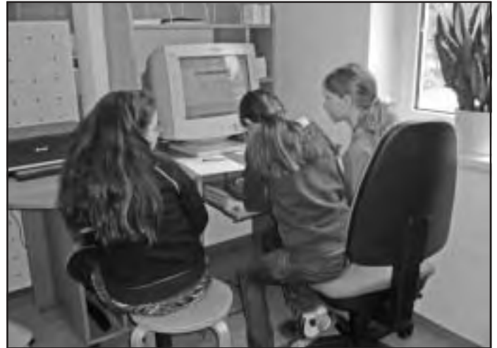
Viel Spaß und Spannung hatten auch die Schüler der 2c und 4b in der Bibliothek

Zur Leseförderung führte die Kinderbibliothek im ersten Halbjahr 2009 für die Klassenstufen 1-6 zahlreiche Veranstaltungen durch. Neben Schriftstellerlesung und Bibliotheksführung ist bei den Kindern besonders die Medienrallye beliebt.