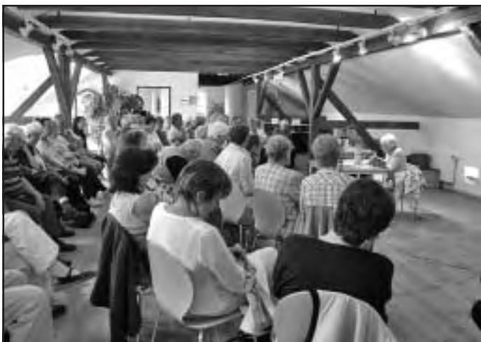
Lesung im romantischen Obergeschoss der Bibliothek

Tel.: 03 37 62 / 8 29 07 Fax: 03 37 62 / 8 29 08 Mobil: 0173 / 5 23 05 14 e-mail: uwekoch-galabau@t-online.de