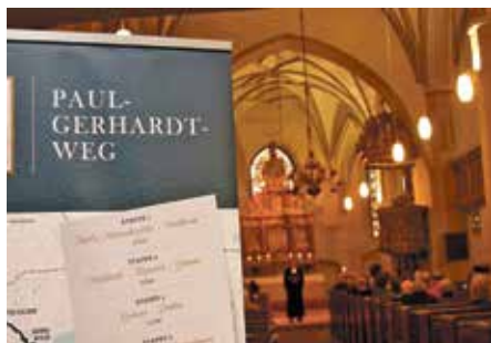
Eröffnung in der Paul-Gerhardt Kirche

Nach mehr als fünfjähriger Planungs- und einjähriger intensiver Vorbereitungsphase ist nun ein durchgehender Wanderweg vom Berliner Stadtzentrum über Mittenwalde bis nach Lübben geschaffen worden. Auf mehr als 140 Kilo-