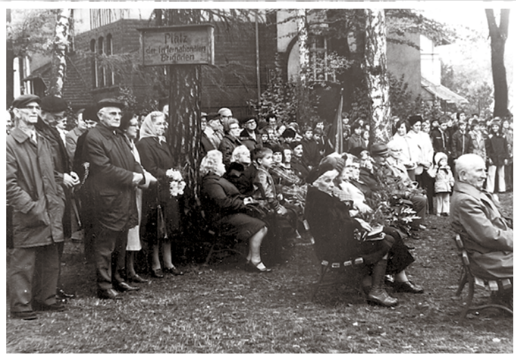
Gedenkfeier im Jahre 1976