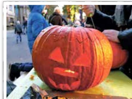
Einsatzbereit für Halloween – die 50 Kürbisse der Gemeinde Zeuthen waren schnell geschnitzt