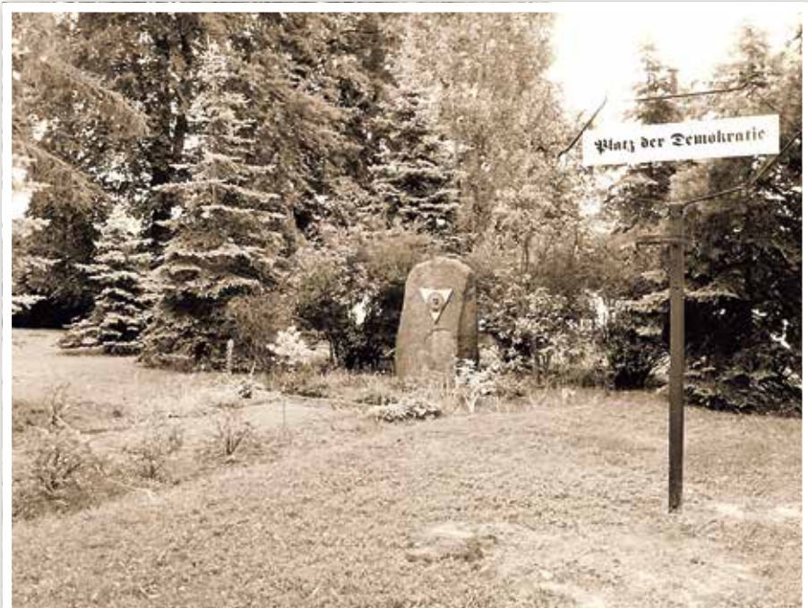
Platz der Demokratie kurz nach der Umbenennung