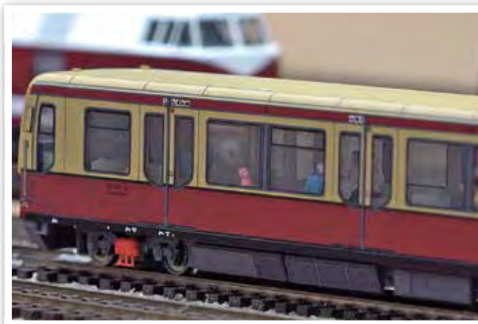
Bei unserer kommenden Ausstellung wird die S-Bahn im Focus stehen.