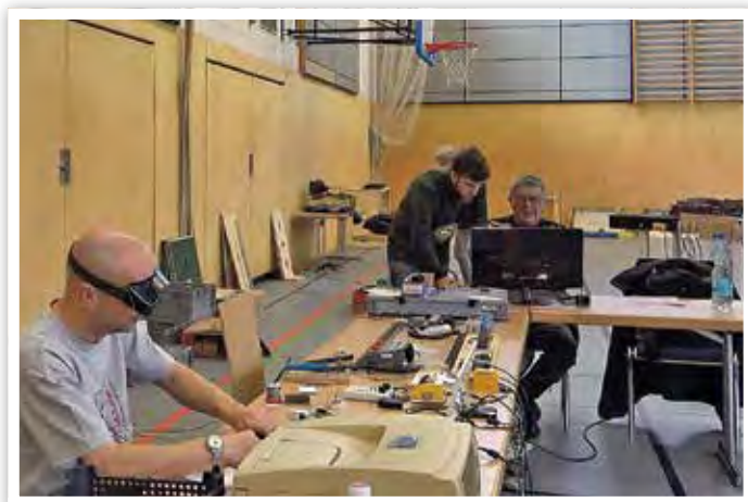
Am Prüfstand: Loks registrieren, Decoder programmieren, Achsen einmessen.