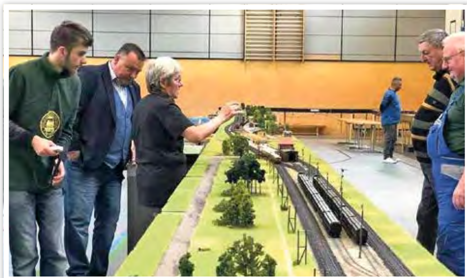
Für die Vorort-Züge bis Zeuthen gab es bis 1945 eine Kehranlage im Bf. Zeuthen.

Hoffen wir, dass wir dann im nächsten Jahr unsere geplante 3-tägige Ausstellung zum 70. Jubiläum der Inbetriebnahme der S-Bahn-Strecke von Berlin-Grü-