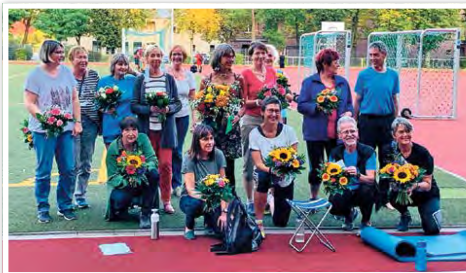
Helferinnen sowie der neue und alte Vorstand der SG Zeuthen e. V.

In der SG Zeuthen engagieren sich an vier Tagen pro Woche ca. dreißig Trainings- und Sportgruppenleiter, um in über zehn Angeboten mit Mitgliedern vom Klein-