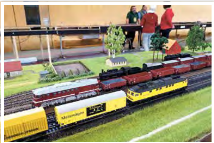
Mit dem Messwagen ausgemessen: eine Runde auf der aufgebauten Anlage = 234 m