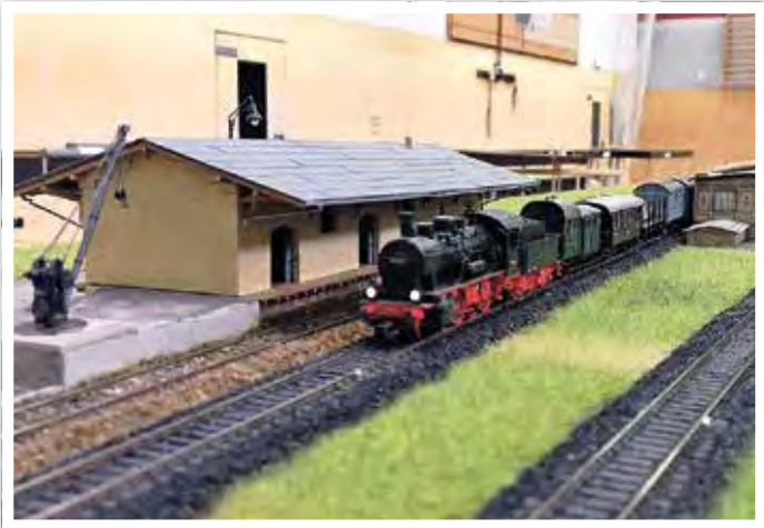
Ein Güterzug am Bf. Zeuthen (1935).