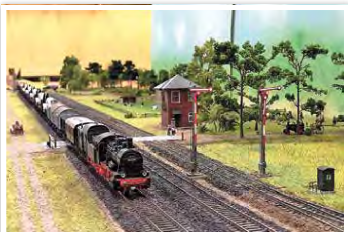
Ein Güterzug an der Nordschranke (1935).