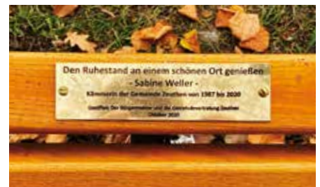
Ein Messingschild erinnert an die Spende.