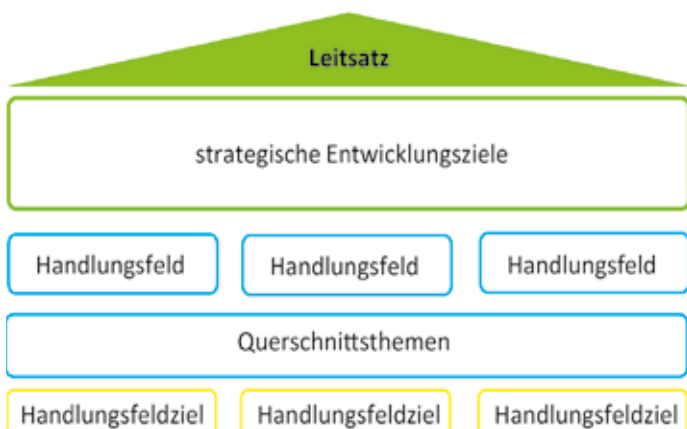
Darstellung: die raumplaner

Der Leitsatz stellt die inhaltliche Klammer des Leitbildes dar, die strategischen Entwicklungsziele konkretisieren die Aussagen des Leitsatzes. Die Handlungsfelder sind die abgeleiteten thematischen Schwerpunkte aus der vorherigen Analyse. Die Handlungsfeldziele konkretisieren die Handlungsfelder. Querschnittsthemen wie Barrierefreiheit und Inklusion werden in allen Handlungsfeldern und -zielen mitgedacht.