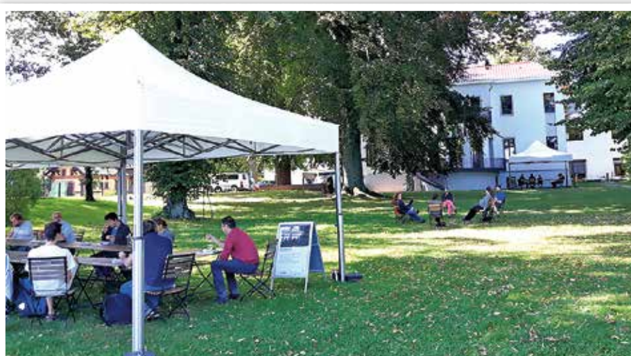
Gespräche am Zeuthener See.

DESY zählt mit seinen Standorten in Hamburg und Zeuthen zu den weltweit führenden Beschleunigerzentren. Woraus besteht die Welt? Woher kommt die kosmische Strahlung? Und welche Technologien machen es möglich, diesen Fragen auf die Spur zu kommen? Um Ant-