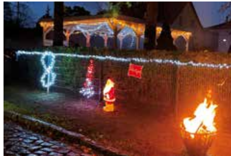
Nettes Beisammensein beim Förderverein der GSAW e. V.