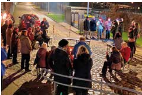
Advent am Bürgerhaus Zeuthen mit einem bunten Programm