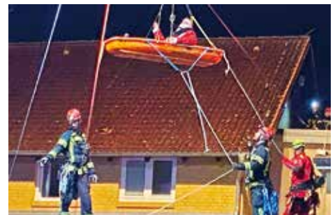
Der Weihnachtsmann wird abgeseilt beim Rüstzug Miersdorf.