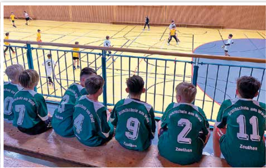
Die Mannschaften nutzten die Zeit zwischen den Spielen, um ihre Mitschülerinnen und Mitschüler der anderen Mannschaft lautstark anzufeuern.

Herzlichen Glückwunsch dazu und bis Ende März zum Landesfinale Handball in der Sporthalle der Grundschule am Wald.