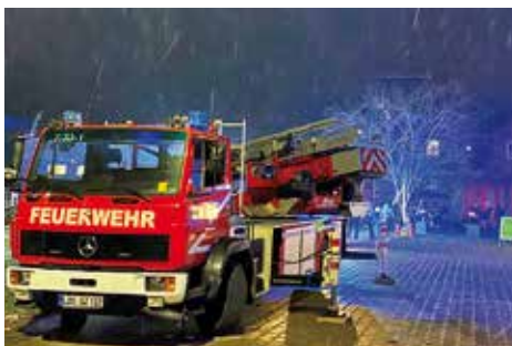
Auftakt beim Löschzug Zeuthen – Blick hinter die Kulissen.