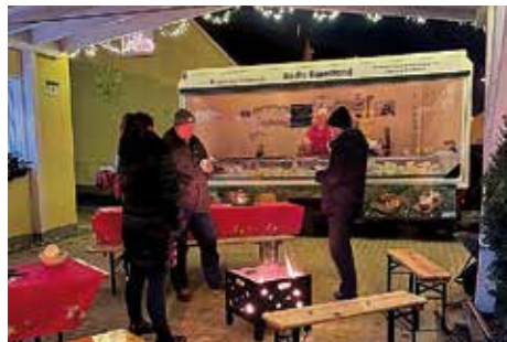
Schweizer Käsesuppe und vieles mehr bei Koch's Käsestand