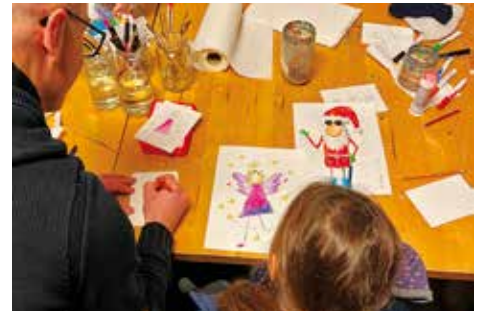
„Schneezauber“ mit dem Kulturverein Zeuthen e. V.