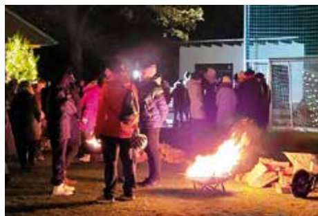
Weihnachtssingen an der Feuerschale beim SCEMZ 1912 e. V.