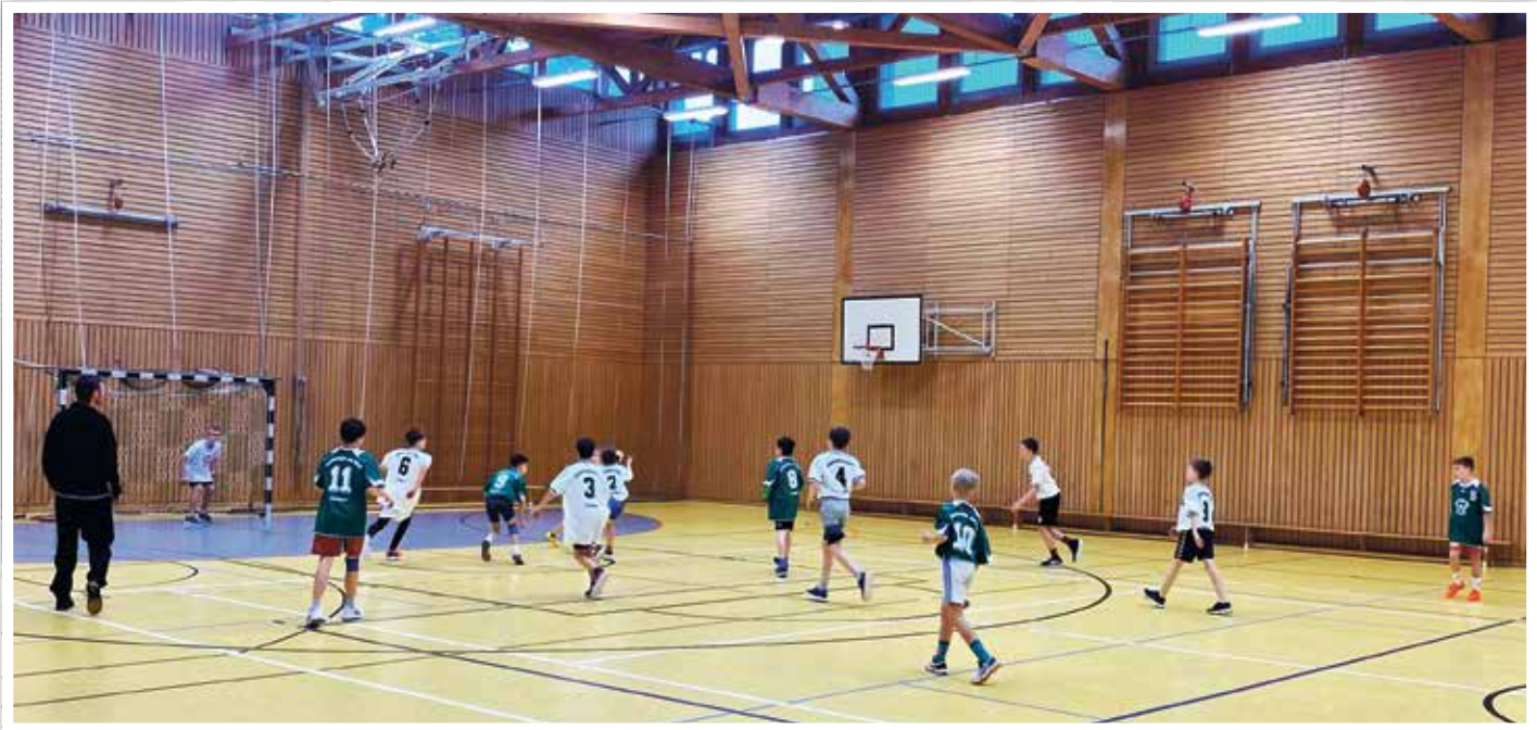
Spannend, schnell und zum Mitfiebern – das 28. Pokalturnier Handball der Grundschule am Wald.