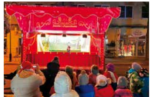
„Zeuthen glüht“ in der Miersdorfer Chaussee