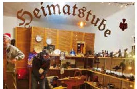
Historische Weihnachten bei den Heimatfreunden Zeuthen e. V.