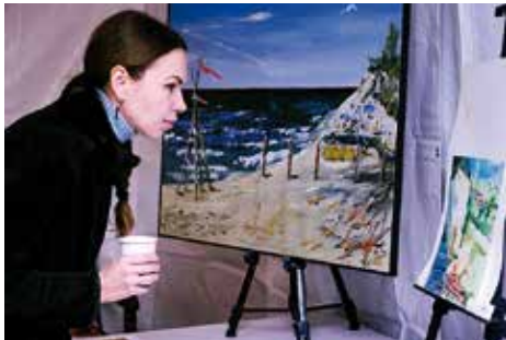
Kleinigkeiten zum Anschauen im Kunsthaus Elena Begma