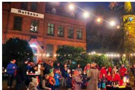
Magie und Zauberei mit Zauberer Pittelkow vorm Rathaus