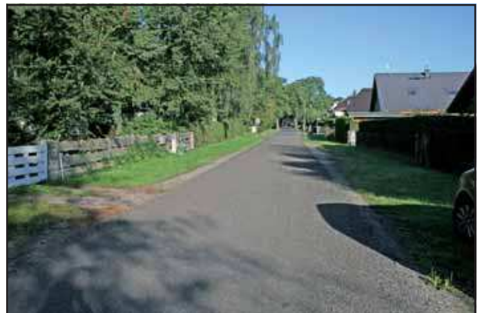
Im Ebereschenring wurde zum Test bituminöses Fräsgut aufgetragen

Für das 2. Halbjahr werden im Frühherbst die Leistungen der Straßenunterhaltung an unbefestigten Straßen und Wegen vorerst mit der bisherigen Vorgehensweise fortgesetzt, da die Testergebnisse erst im Frühjahr 2011 vorliegen