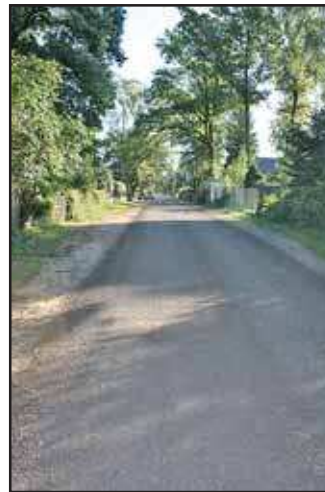
Ein Teil des Lindenrings gilt auch als Teststrecke für die beschriebene Variante in der Straßenunterhaltung

einem Abschnitt im Lindenring und im Ebereschenring erstmals im Juni/ Juli 2010 einen Test gefahren, der von den bisherigen Leistungen abweicht. Es wurde Fräsgutmaterial, bestehend aus bituminösem Material, im Mittel ca. 6 cm dick aufgetragen. Wenn diese Variante der Straßenunterhaltung vor allem den Herbst und Winter qualitativ gut übersteht, wäre das eine weitere Möglichkeit in der Straßenunterhaltung der unbefestigten Straßen und Wege. Die Staubbelastung könnte dann stark verringert werden. Wird der Unterhaltungszyklus mit dieser Bauart verlängert, würden damit auf Dauer auch Kosten eingespart werden. Diese könnten wiederum in den Straßenbau fließen, so dass irgendwann alle Sandstraßen aus dem Ortsbild verschwinden könnten.