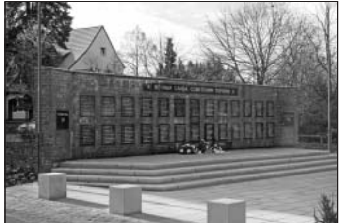
Sowjetisches Ehrenmal in der Dorfstraße in Miersdorf