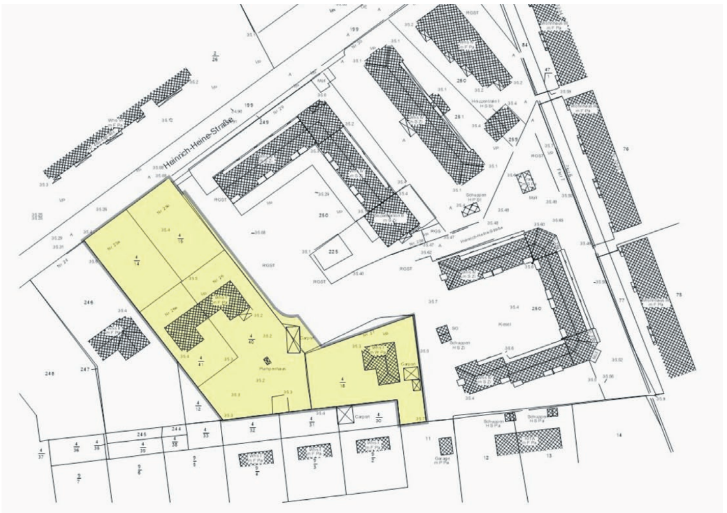
Geltungsbereich vorhabenbezogener Bebauungsplan Nr. 118-2 „Heinrich-Heine-Straße II“ Gemarkung Zeuthen, Flur 3, Flurstücke 4/14, 4/15, 4/18, 4/40, 4/41, 250 teilweise