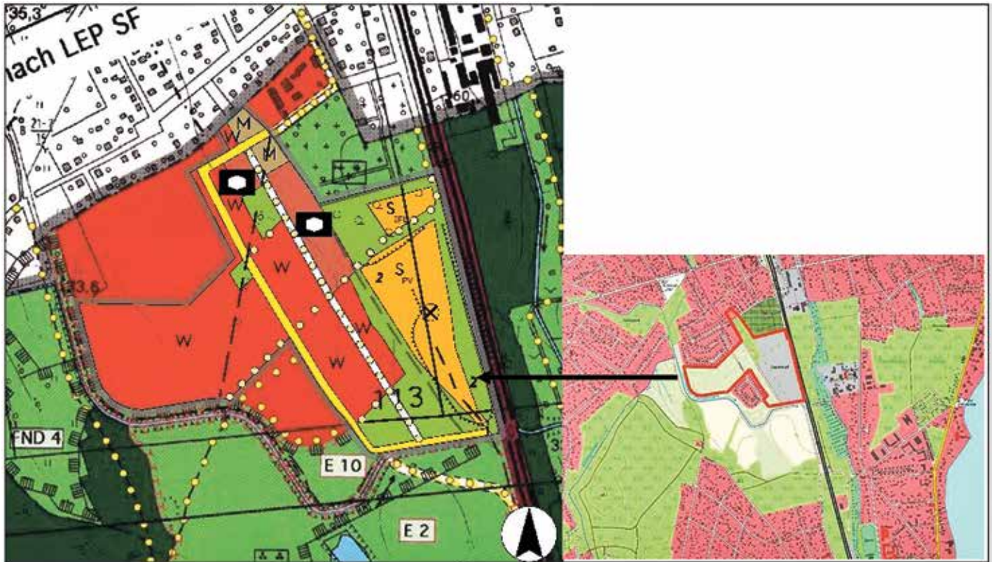
Übersichtsplan mit Geltungsbereich der 4. FNP-Änderung der Gemeinde Zeuthen