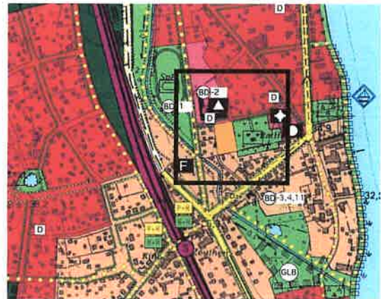
FNP STAND 10.11.2008