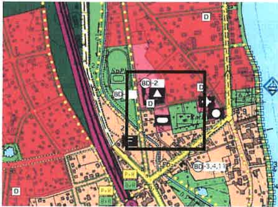
FNP STAND 1.12.2000