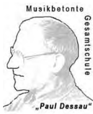
Musikbetonte Gesamtschule „Paul Dessau“