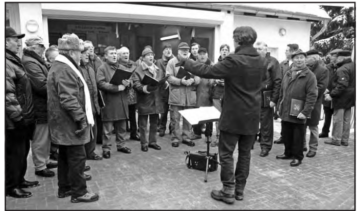
Der Männerchor Zeuthen singt