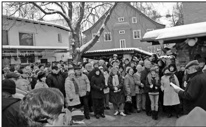
Fast ganz Zeuthen auf den Beinen

Marzipan mit einem großen Messer anschnitten. Die Bäckerei Wahl von nebenan gratulierte auf eine besonders süße Weise. Obwohl es