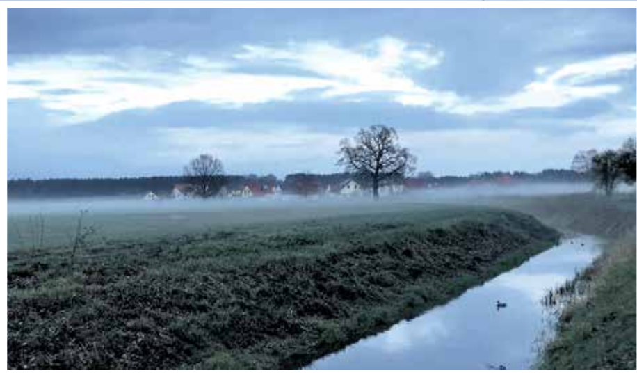
Zeuthener Winkel: Malerische Wiesenlandschaft, Brutgebiet von Feldlerche und Baumpieper. Im Hintergrund stehen die Eichen entlang des Wanderweges.

sierten Bürger die Möglichkeit haben, ihre Meinung einzubringen und sich am Planungsprozess zu beteiligen.