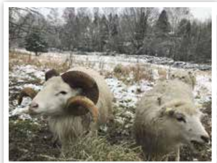
Skudden, die kleinen Schafe weiden auf den Wiesen am Höllengrund. Auch sie stehen auf einer Roten Liste – die der bedrohten Nutztierassen.

Um dem Investor und dem geplanten Wohnungsbau entgegenzukommen, könnte als Ausgleich eine dichtere Bebauung entlang der ehemaligen Baustraße in Erwägung gezogen werden. Bei dieser Entscheidung sollten alle interes-