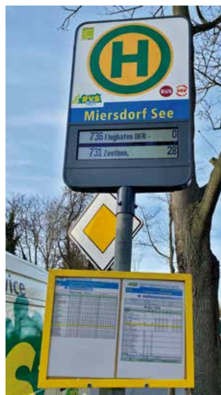
Das neue dynamische Fahrgastinformationssystem – zeitgemäß und praktisch.