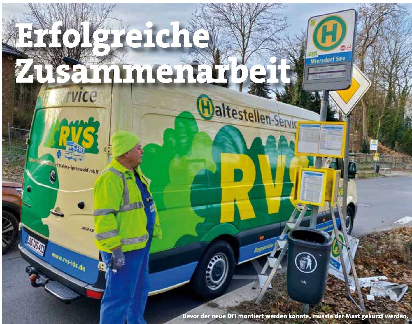
Bevor der neue DFI montiert werden konnte, musste der Mast gekürzt werden.