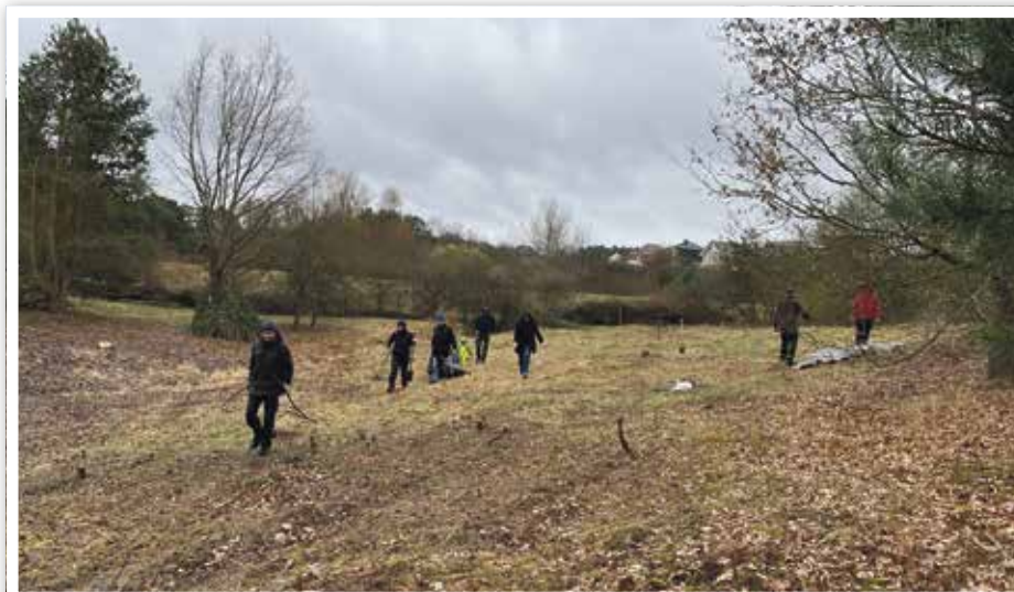
NABU-Arbeitseinsatz zur Rettung des Trockenrasens am Pulverberg im Frühjahr 2021. Der sonnige, trockene Hang war schon fast zugewachsen.

Eine andere Bedrohung ist der Siedlungsdruck, der bei uns seit 1990 stark