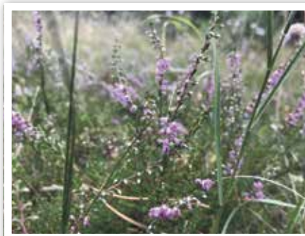
Schaut man genauer hin, entpuppen sich auf jedem Quadratmeter eine Fülle von Überlebenskünstlern, hier Heidekraut am Pulverberg.