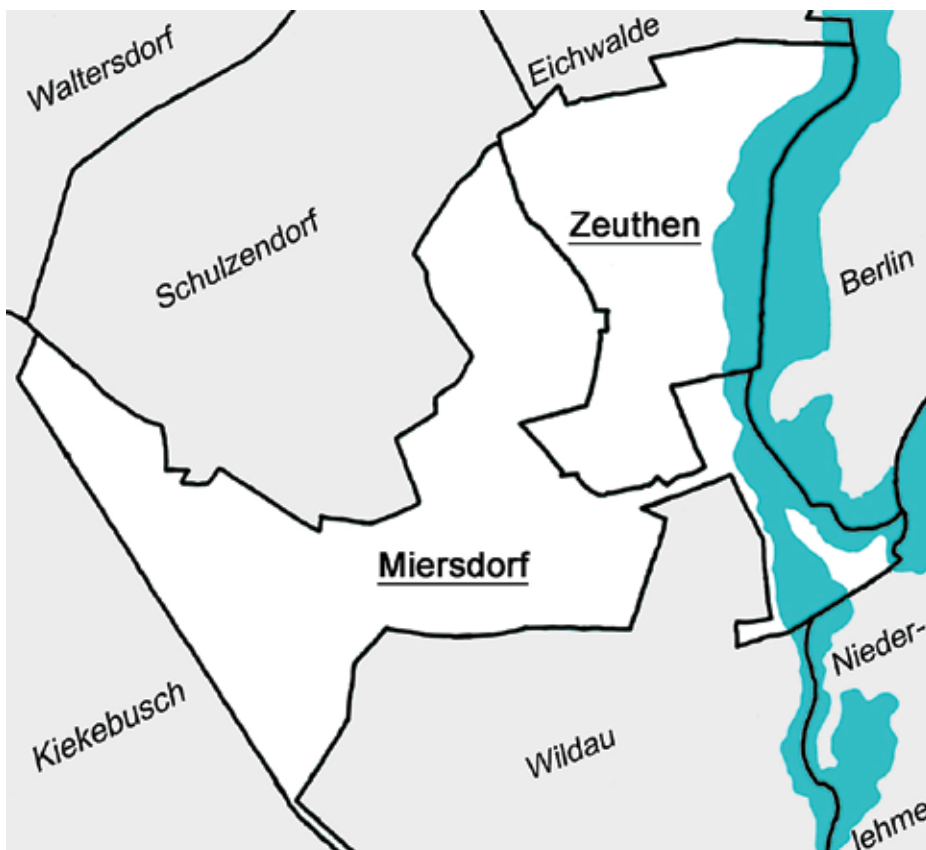
Gemeindegrenzen Zeuthen, Miersdorf und Umgebung (um 1938)

Bei näherer Betrachtung des Grenzverlaufs zwischen beiden Gemeinden fällt