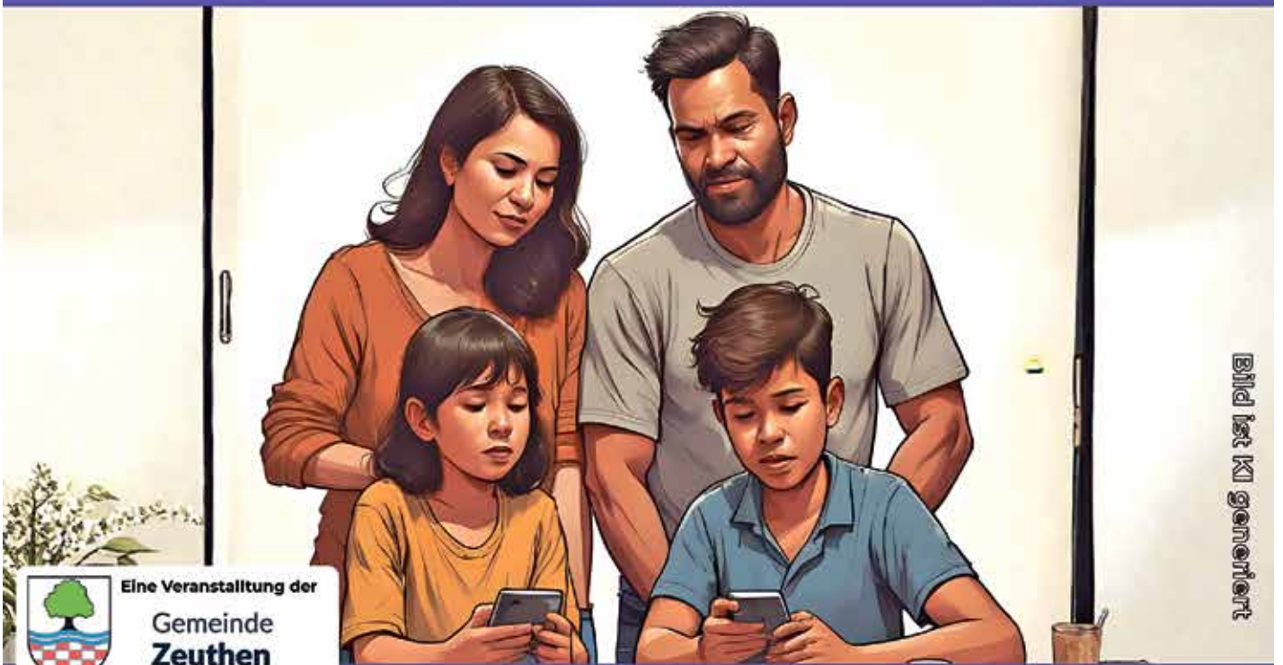
Bild ist KI generiert