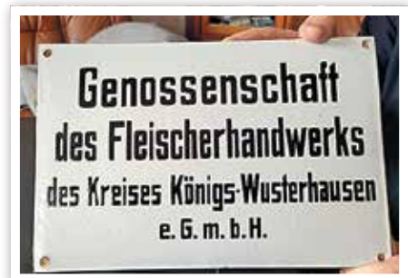
Die Fleischerei Hölzner war auch Teilhaber der Fleischerhandwerk-Genossenschaft