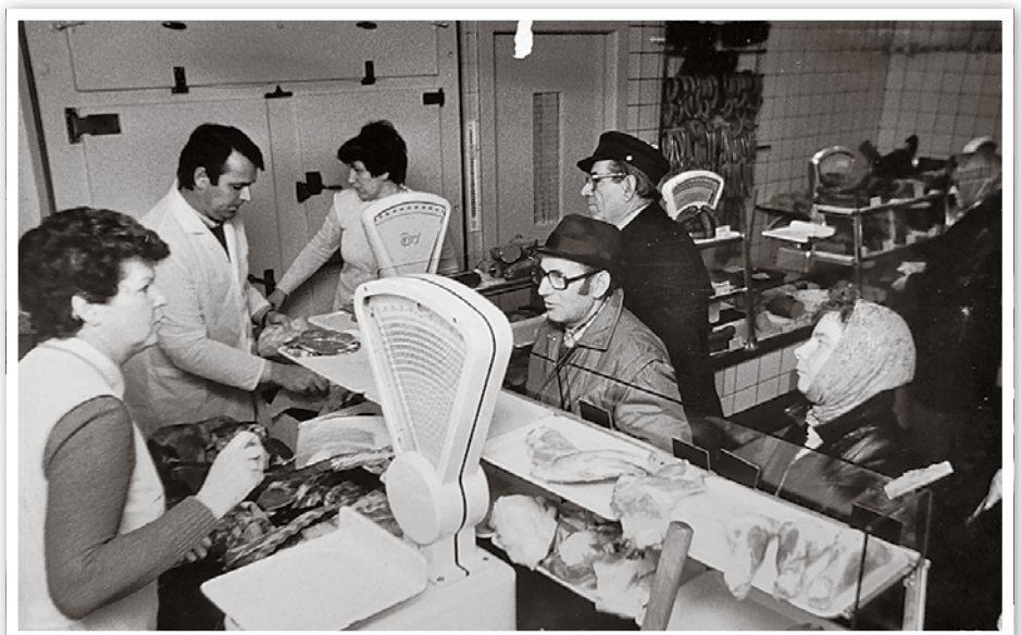
In der Fleischerei – Ende der 1970er-Jahre