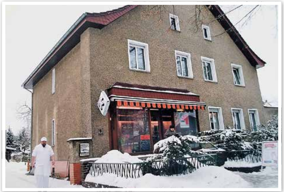
Fleischerei Hölzner 2010