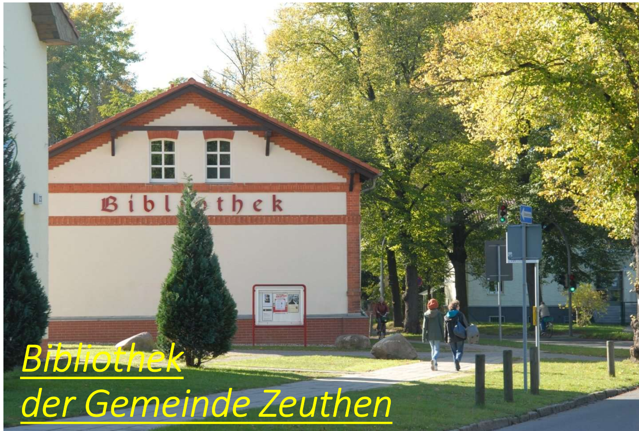
Bibliothek der Gemeinde Zeuthen