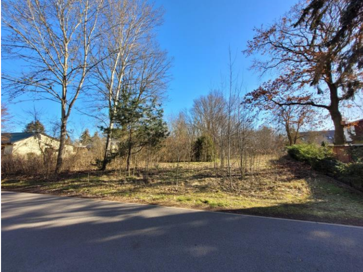
Blick von der Straße Jägerallee