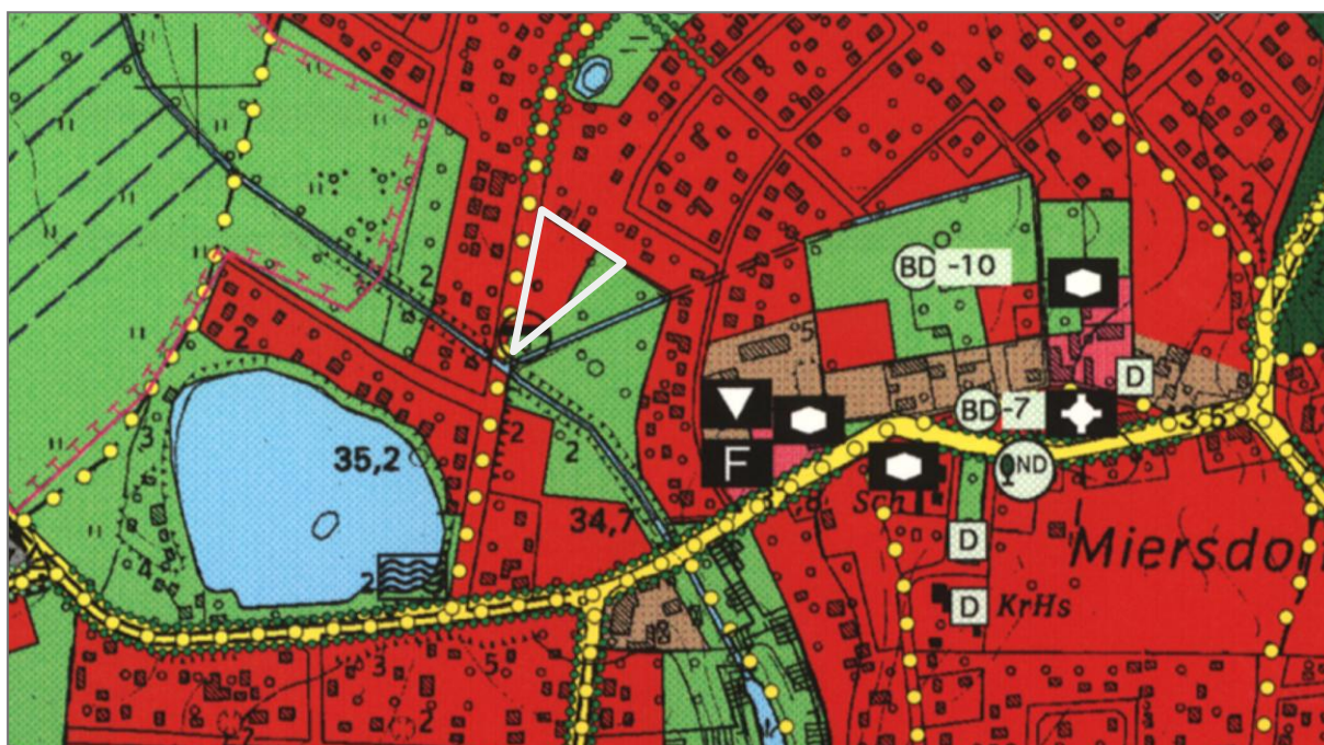
Abb.: Auszug aus dem Flächennutzungsplan mit Kennzeichnung des Plangebietes (rot: Wohnbauflächen, grün: Grünfläche)

Der Flächennutzungsplan der Gemeinde Zeuthen enthält im Bereich des Plangebietes die Darstellungen Wohnbaufläche und Grünfläche (Bereich der gegenwärtig unbebaut ist). Der Bebauungsplan soll und kann aus den Darstellungen des Flächennutzungsplans entwickelt werden, da die Festsetzung eines reinen Wohngebietes und einer privaten Grünfläche vorgesehen ist.