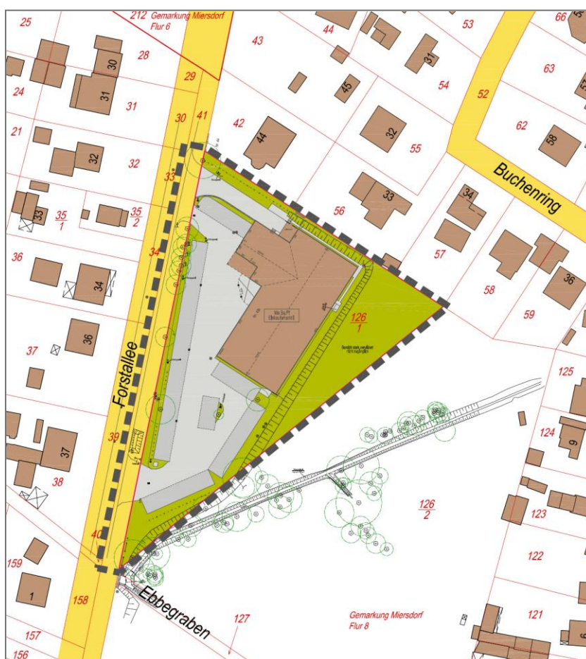
Abb.: Bestandssituation im Plangebiet

Die Flächen zwischen dem Gebäude und der Forstallee wurden überwiegend für Kundenstellplätze und die Anlieferung genutzt und sind entsprechend versiegelt (Betonpflaster). Vor dem Grundstück Forstallee 43b ist gegenwärtig kein Gehweg vorhanden. Auf dem Grünstreifen im Bereich der Grundstücksgrenze zur Forstallee sind mehrere Birken aufgewachsen, die meist auf dem Straßengrundstück aber direkt an der Flurstücksgrenze stehen. Eine ältere Weide befindet sich im Norden des Plangebietes und steht direkt auf der Grundstücksgrenze.