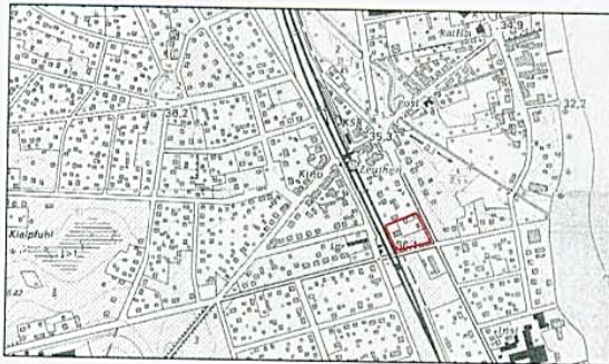
Lage des Geltungsbereiches der FNP-Berichtigung M 1 : 20 000