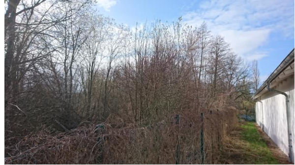
Abbildung 4: Übergang vom Gebäude zum angrenzenden Erlenbruch