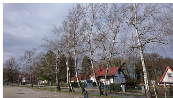
Abbildung 2: Baumreihe aus Birken zwischen Parkplatz und Forstallee