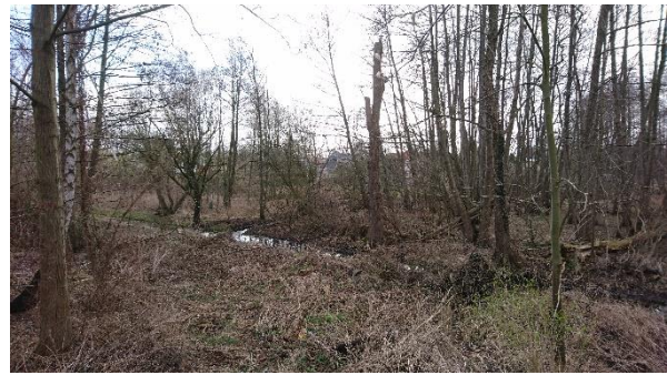
Abbildung 6: Erlenbruchwald mit Gräben