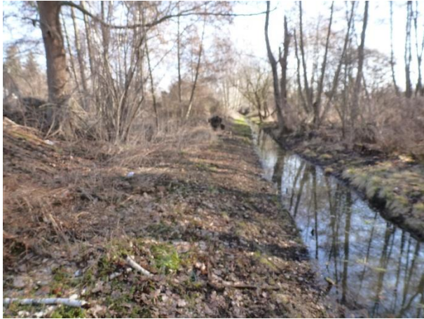
Abbildung 8: Graben südlich des Plangebietes (Blick nach Nordost)