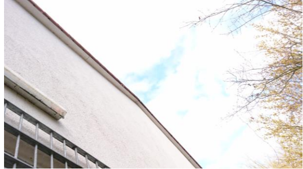
Abbildung 10: Nistmaterial im Dachkasten des Nordgiebels