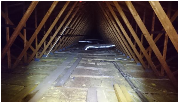
Abbildung 11: Blick in Dachraum