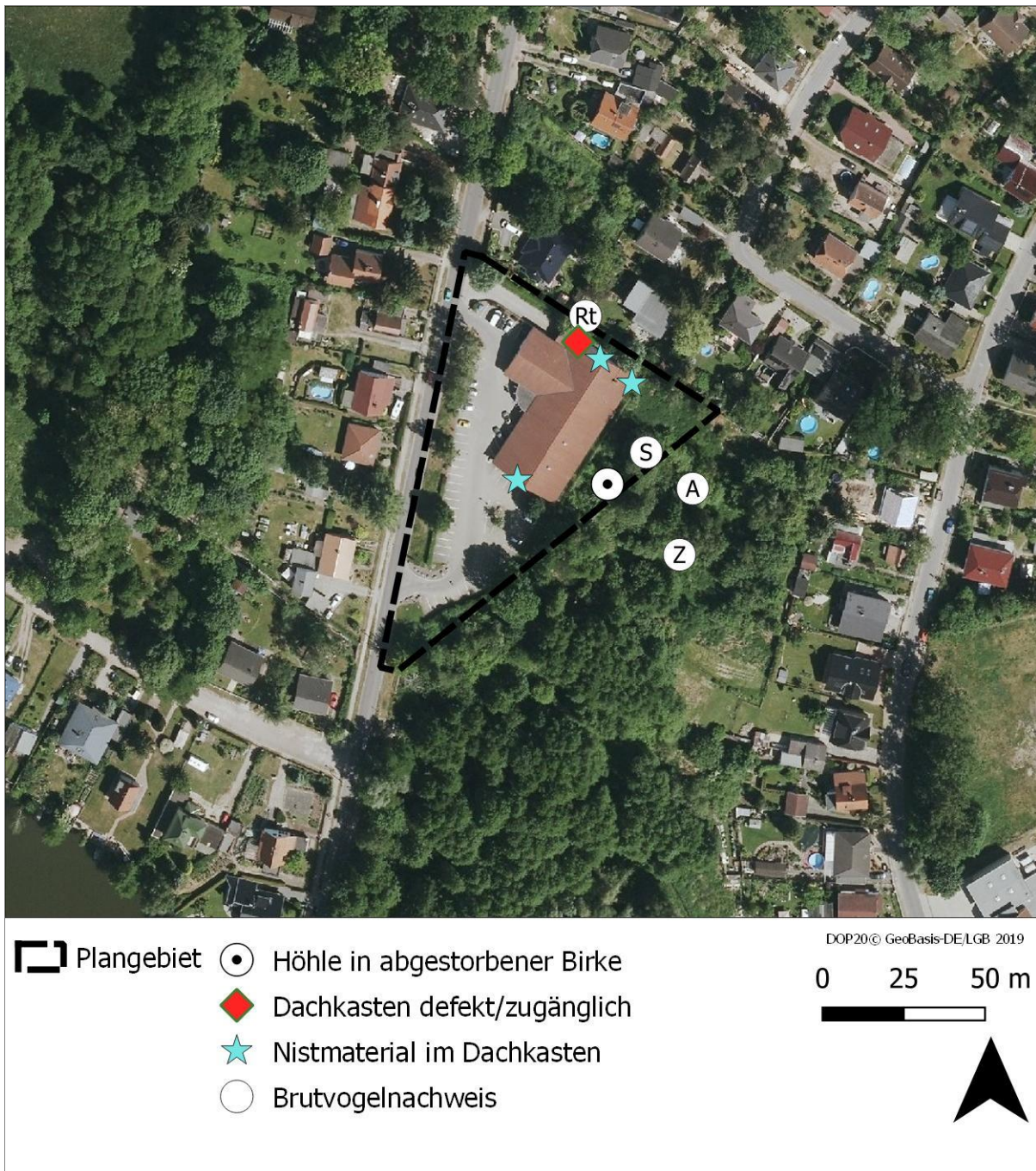
Abbildung 13: Ergebnisse der faunistischen Untersuchungen