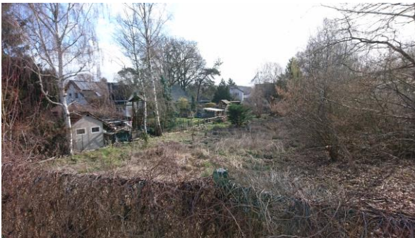
Abbildung 5: Nördlicher Teil der Erlenbruchfläche im Plangebiet und angrenzende Bebauung