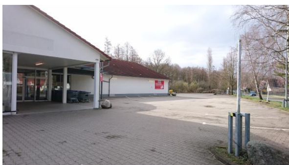
Abbildung 1: Marktgebäude und Parkplatz