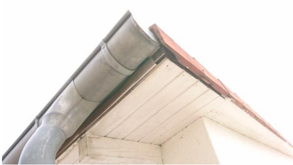
Abbildung 9: Einschlufmglichkeit im Dachkasten