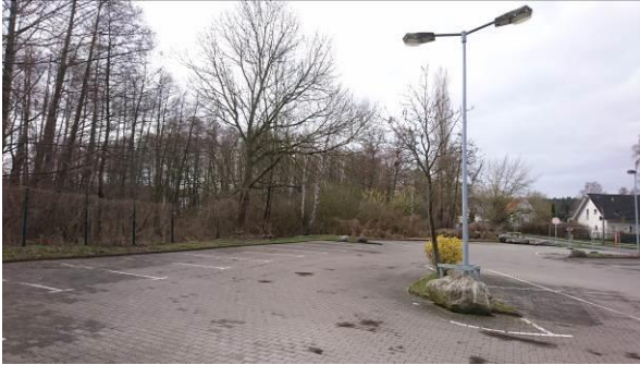
Abbildung 3: Parkplatz und Erlenbruchwald im Hintergrund