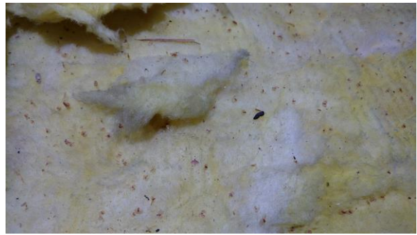
Abbildung 12: Fledermauskotkrmel